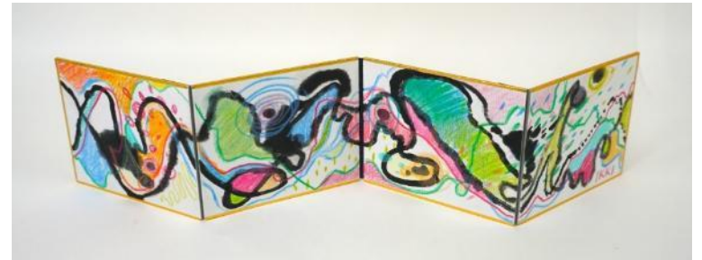
No.61「ウェーブ びょうぶ」