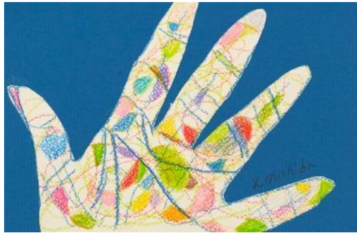
No.57「世界をぬりかえよう」