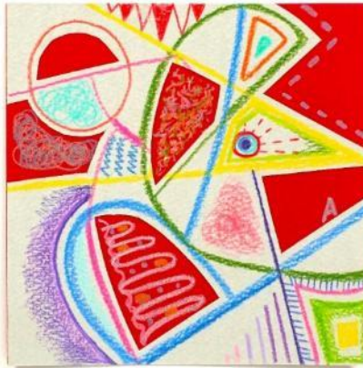
No.58「ホワツ ユア ネイム?」