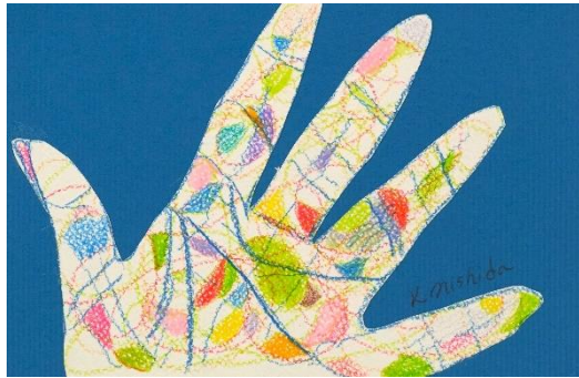
No.57「世界をぬりかえよう」