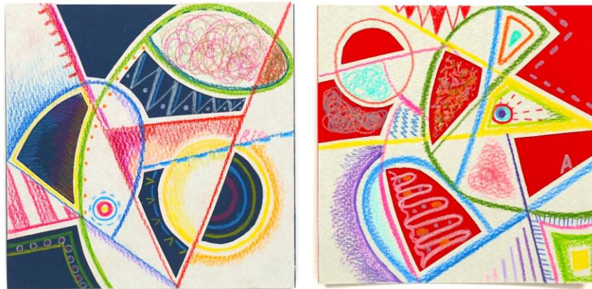
No.58「ホワツ ユア ネイム?」