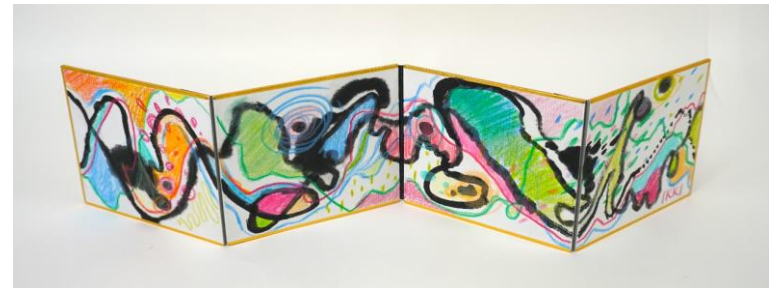
No.61「ウェーブ びょうぶ」